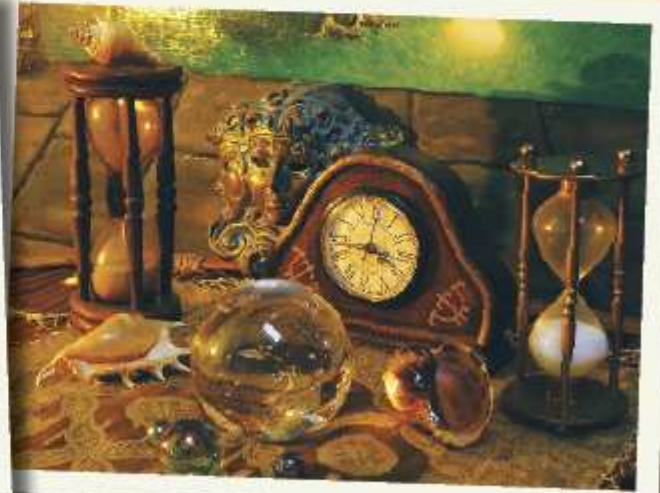
Artysta podczas malowania i przedmioty z jego obrazów... szklane kule, zegary, klepsydry i muszle.