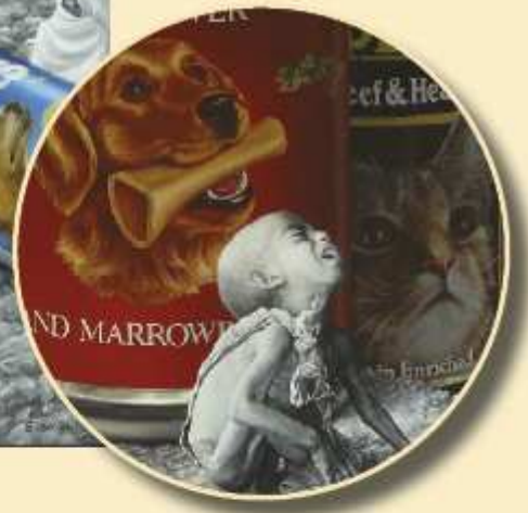
Reklama żywności, olej na płótnie 59 x 49cm