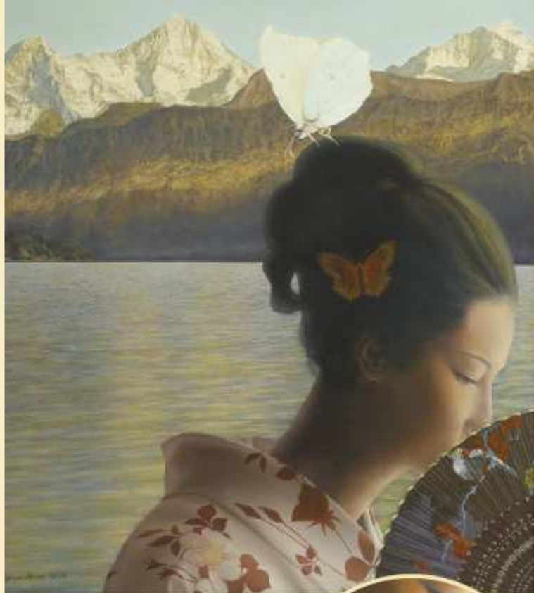
Orientalna zalotność, olej na płótnie, 63 x 56cm