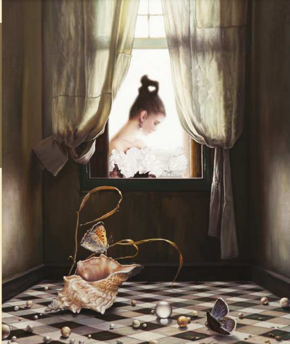
Vermeerowski szept , olej na płótnie, 58 x 48cm