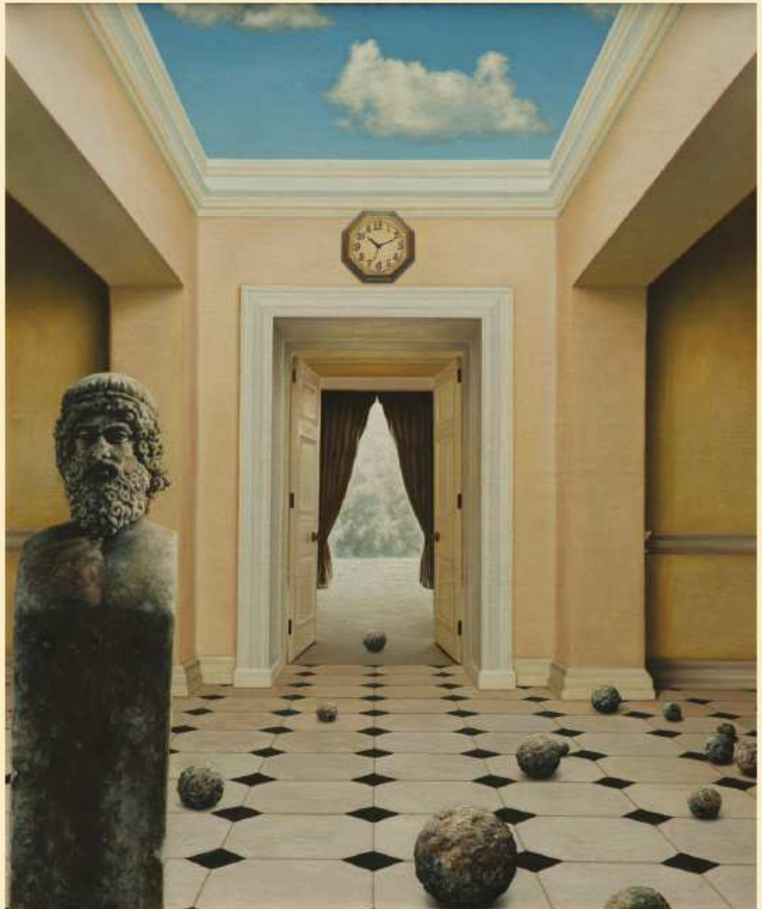
Wieczność materii , olej na płótnie, 49 x 41cm

detali we wcześniejszych obrazach stosowałem też pędzle okrągłe do min. grubości 00. Aktualnie dążę do większej malarskości płócien i tak cieniutkich pędzli praktycznie już nie używam”.