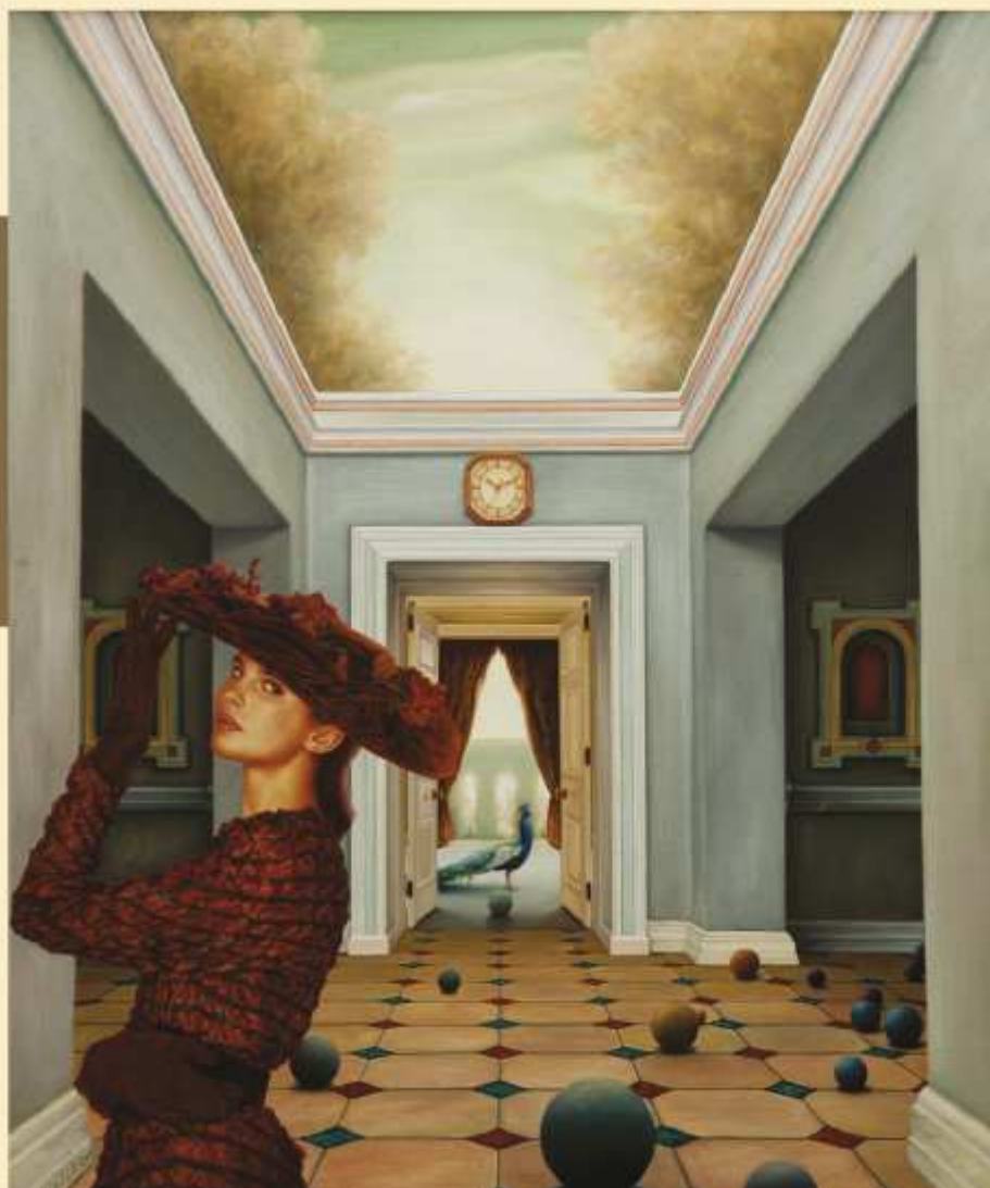
Groteskowe przedpołudnie, olej na płótnie, 61 x 50cm

DETAL Fragment ukazuje dążność do perfekcyjnego oddania zróżnicowanej materii rzeczy. Precyzyjna kreska współtworzy wraz z barwą piękno i harmonię miniaturowych detali eksponując wachlarz na planie pierwszym.