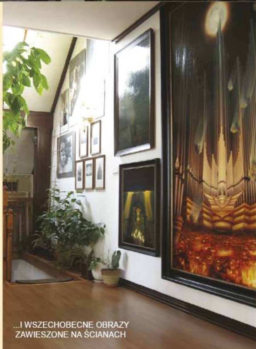
...I WSZECHOBECNE OBRAZY ZAWIESZONE NA ŚCIANACH

W obrazach stworzonych przez Grzegorza Bialika intryguje nie tylko głębia przekazu, ale również bogactwo środków formalnych. ▷