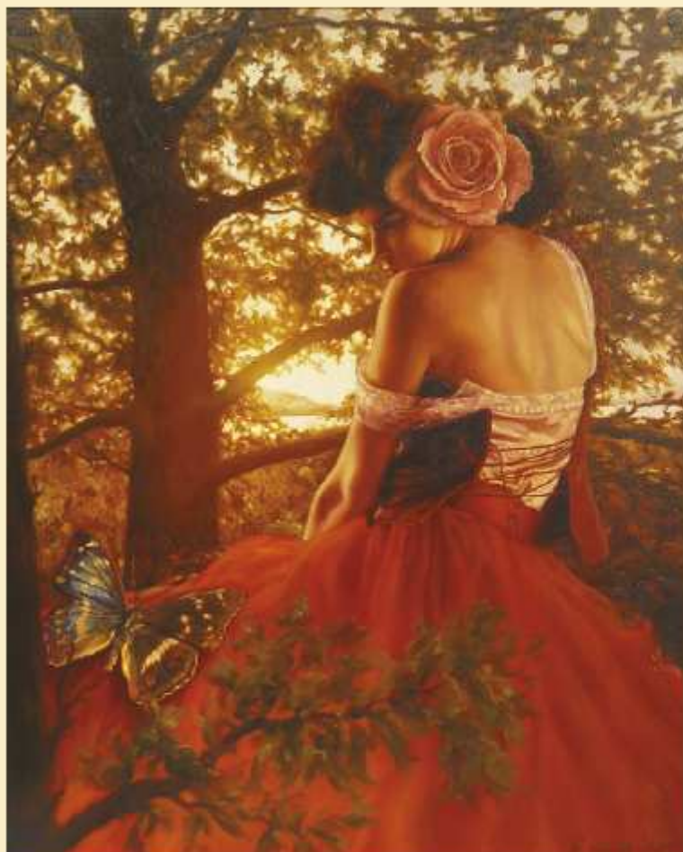
Rajski Ptak , olej na płótnie, 100 x 80cm

Grzegorz Bialik niejednokrotnie też podkreślał, iż „zawsze warto podejmować trud pójścia własną ścieżką, bo być może kiedyś przerodzi się ona w szeroką drogę?” Jego dzieła od razu przykuwają wzrok swoją niezwykłą estetyką. Nastrojowe pejzaże z klepsydrami, olśniewające bogactwem detali ogrody oraz przejmujące psychologiczną głębią portrety wprowadzają nas w intymny świat myśli i uczuć artysty. Sugestywne rekwizyty zaklęte w magicznych krainach nie tylko dostarczają bogactwa estetycznych doznań, lecz są też wyrazem refleksji i zainteresowań ich twórcy. „Moje obrazy to kartki z pamiętnika wewnętrznego” – wyznaje Grzegorz Bialik – „artystyczne kreacje myśli, uczuć i nastrojów, które razem wzięte stanowią świadectwo mojej duchowej egzystencji. Interesuje mnie wszystko, co wiąże się z moją duchowością, a następnie staje się inspiracją i tworzywem kolejnych kompozycji malarskich. Motywem nadrzędnym jest ludzka egzystencja, widziana w wielu aspektach. Bliskie są mi klimaty tęsknoty i nostalgii, pociąga mnie magia miejsc oraz ulotność chwili, refleksja i zaduma. Romantyczna marzycielskość przemieszana z egzystencjalnym bólem i duchem wiary w życie po życiu – budzi wyobraźnię tajemnicą. Wszystko przeplata duch nieskończonej nadziei...”