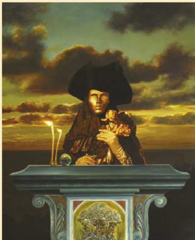
Jej Wysokość - Dekadencja, olej na płótnie, 100 x 80cm