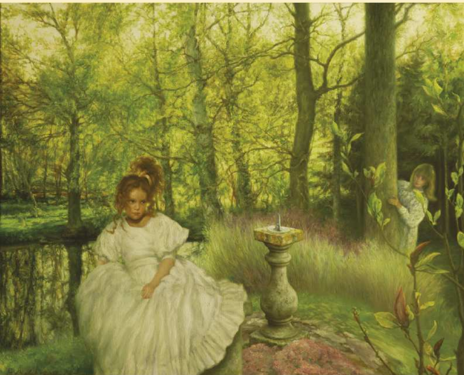
Ogród beztroski , olej na płótnie, 80 x 100cm

Gabriel Rossetti oraz Edward Burne-Jones. Jego niekwestionowanym autorytetem jest jednak Rembrandt, który od dawna zachwyca malarza „genialną maestrią efektów strukturalnych oraz wspaniałym światłocieniem o wymiarze wręcz duchowym”.