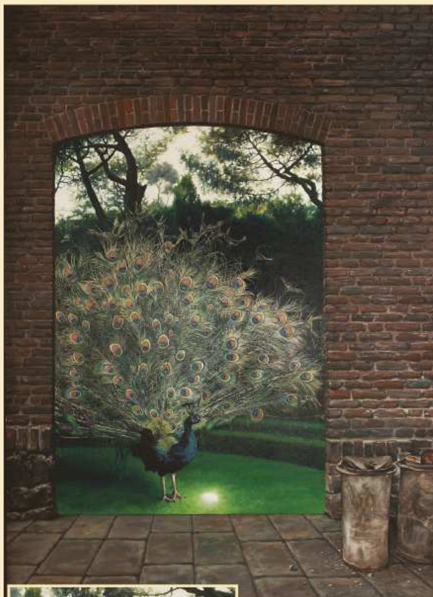
Rajskie marzenie, olej na płótnie, 175 x 129,5cm